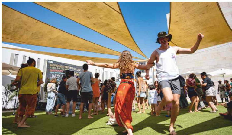
Ateliê com artistas - Pátio das Artes

Each concert is a unique experience, yet the emotions that move us are the same. We enter step by step, heart racing and a smile on our face, counting down to the moment the artist steps onto the stage. We take in the setting, the people around us, and feel a