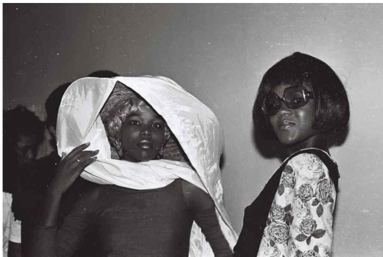
Luandar (1989 – 1994), fotografia de Cassiano Bamba

..... Tracing a chronological period from 1960 to 2025, in Angola, the collective exhibition Balumuka! presents a multidisciplinary artistic production centred on sound (and consequently on image and movement) – the communal practice[i] around it capable of sustaining resistance and the social relations it produces. The intense, sometimes turbulent rhythms and movements refuse to be captured within the vile framing of oppressive and prejudiced realities, carrying within their artistic expression the possibility of radical transformation.