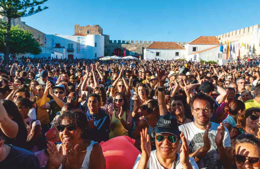
Público no Castelo